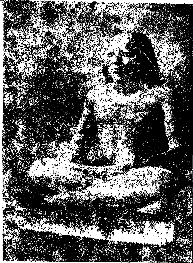
تمثال بديع من الحجر الجيري الملون يمثل كاتباً مترجماً ، وعلى ركبتيه ملف منشور من البردي - سقارة ، الأسرة (٤) • ( محفوظة بالمتحف المصرى )