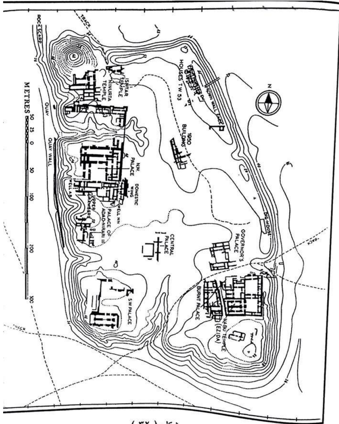
شكل ( ٣٢ ) خارطة مدينة نمرود ( كالح )